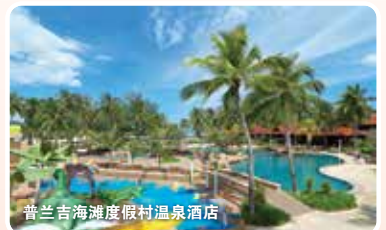
普兰吉海滩度假村温泉酒店