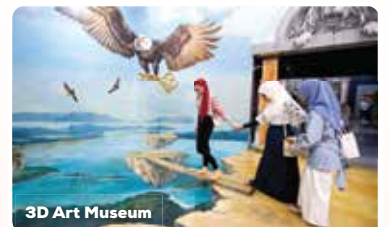
3D Art Museum