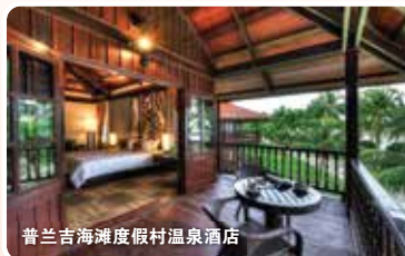
普兰吉海滩度假村温泉酒店