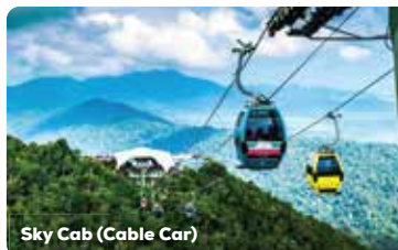
Sky Cab (Cable Car)