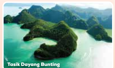
Tasik Dayang Bunting