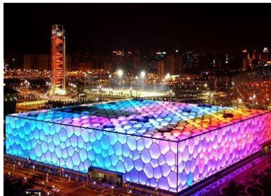
国家游泳中心“水立方”