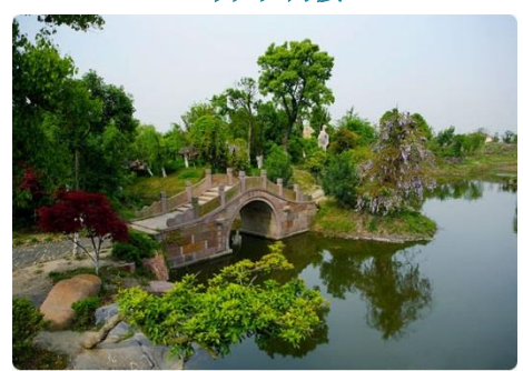
小村洲生态示范村